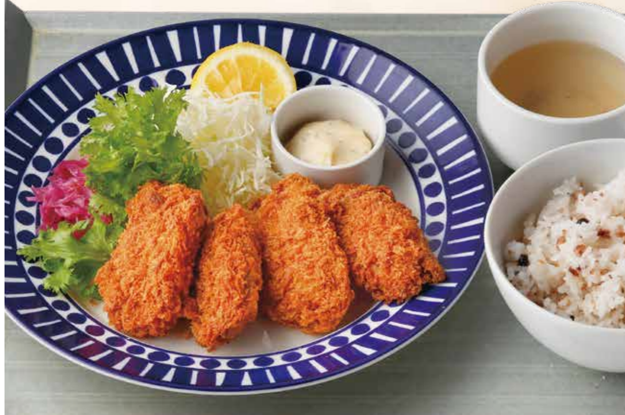
Breaded Oysters 4 piece set 牡蠣フライ4ピースランチ ¥1,180 (税込1,298) 牡蠣スープ / 十八穀米ごはん 付