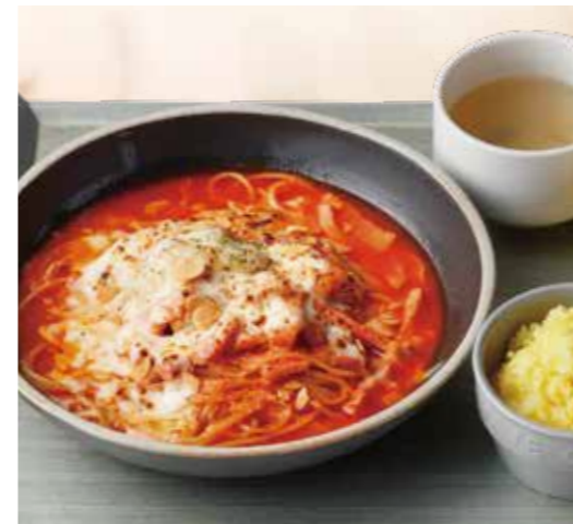
Lunch of tomato soup pasta with oysters, bacon, and cheese 牡蠣とベーコン、チーズの トマトスープパスタランチ Regular ¥1,280 (税込¥1,408) Large ¥1,480 (税込¥1,628) 牡蠣スープ / サラダ / サフランライス 付