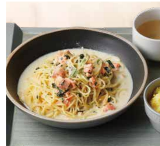
Oyster, Salmon, and Spinach Cream Pasta Lunch 牡蠣とサーモン、ほうれん草の クリームパスタランチ Regular ¥1,480 (税込¥1,628) Large ¥1,680 (税込¥1,848) 牡蠣スープ / サラダ / サフランライス 付