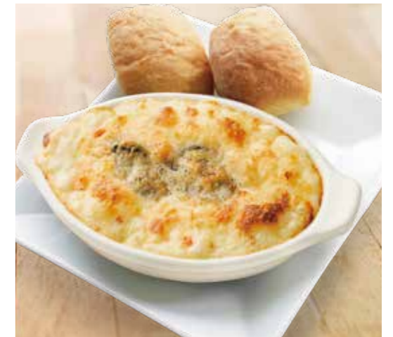
Oyster and cheese cream gratin Lunch 牡蠣とチーズの クリームグラタンランチ ¥1,280 (税込¥1,408) 牡蠣スープ / サラダ 付