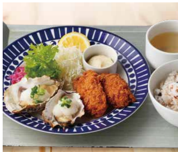
Grilled oysters with sudachi zest and Breaded Oysters 牡蠣の素焼きスタチおろしとカキフライランチ ¥1,380 (税込¥1,518) 牡蠣スープ / 十八穀米ごはん 付