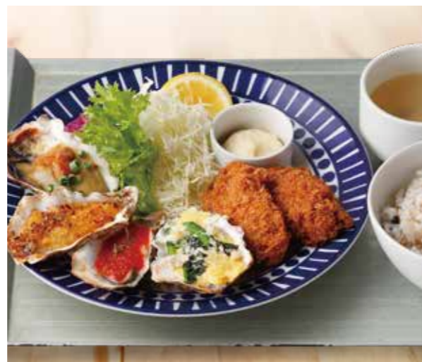
Four kinds of grilled oysters and Breaded Oysters lunch 焼き牡蠣4種とカキフライランチ ¥1,780 (税込¥1,958) 牡蠣スープ / 十八穀米ごはん 付