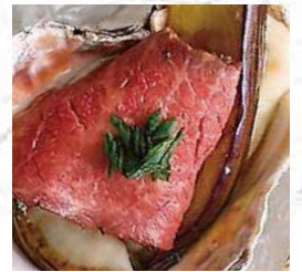
⑤生牡蠣カクテル 揚げ茄子とローストビーフ