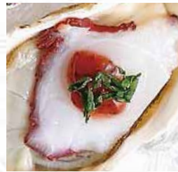
④生牡蠣カクテル タコと梅肉