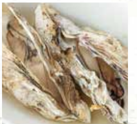
⑩牡蠣の白ワイン蒸し