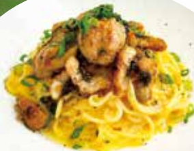
牡蠣とウナギ、 卵黄の Pasta 花椒風味