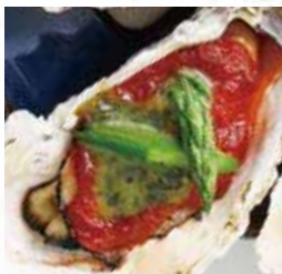
⑬グリルドオイスター アスパラと バジルトマトソース