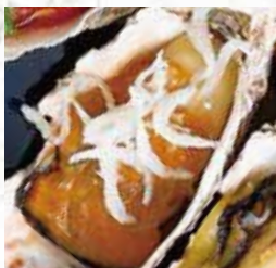
⑭グリルドオイスター しらすとねぎ味噌