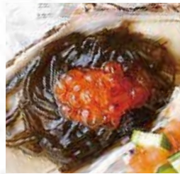
③生牡蠣カクテル もずくとイクラ添え