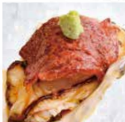
⑦生牡蠣と牛ザブトンの 炙り わさび添え