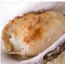
⑪牡蠣のバターソテー