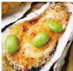
⑫グリルドオイスター 香草パン粉ガーリックバター と枝豆