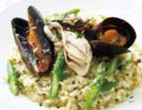
牡蠣とムール貝 アスパラガスの バジルクリームリゾット