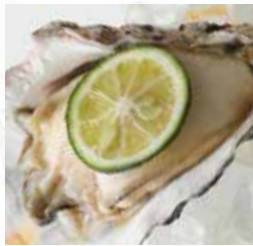
②漬け牡蠣 すだち添え