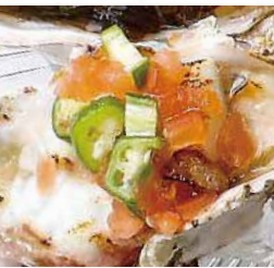
⑥生牡蠣と真鯛の炙り トマト オクラのソース