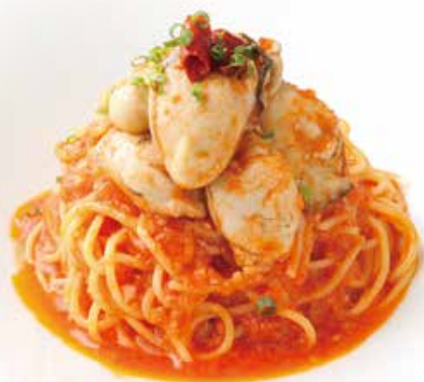
Oyster and Tomato sauce Pasta