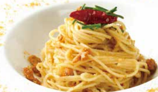
Spaghetti Aglio e Olio with Dried Mullet Roe