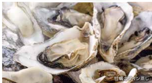
牡蠣のワイン蒸し