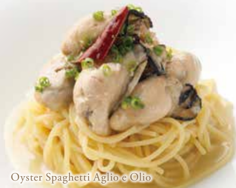
Oyster Spaghetti Aglio e Olio