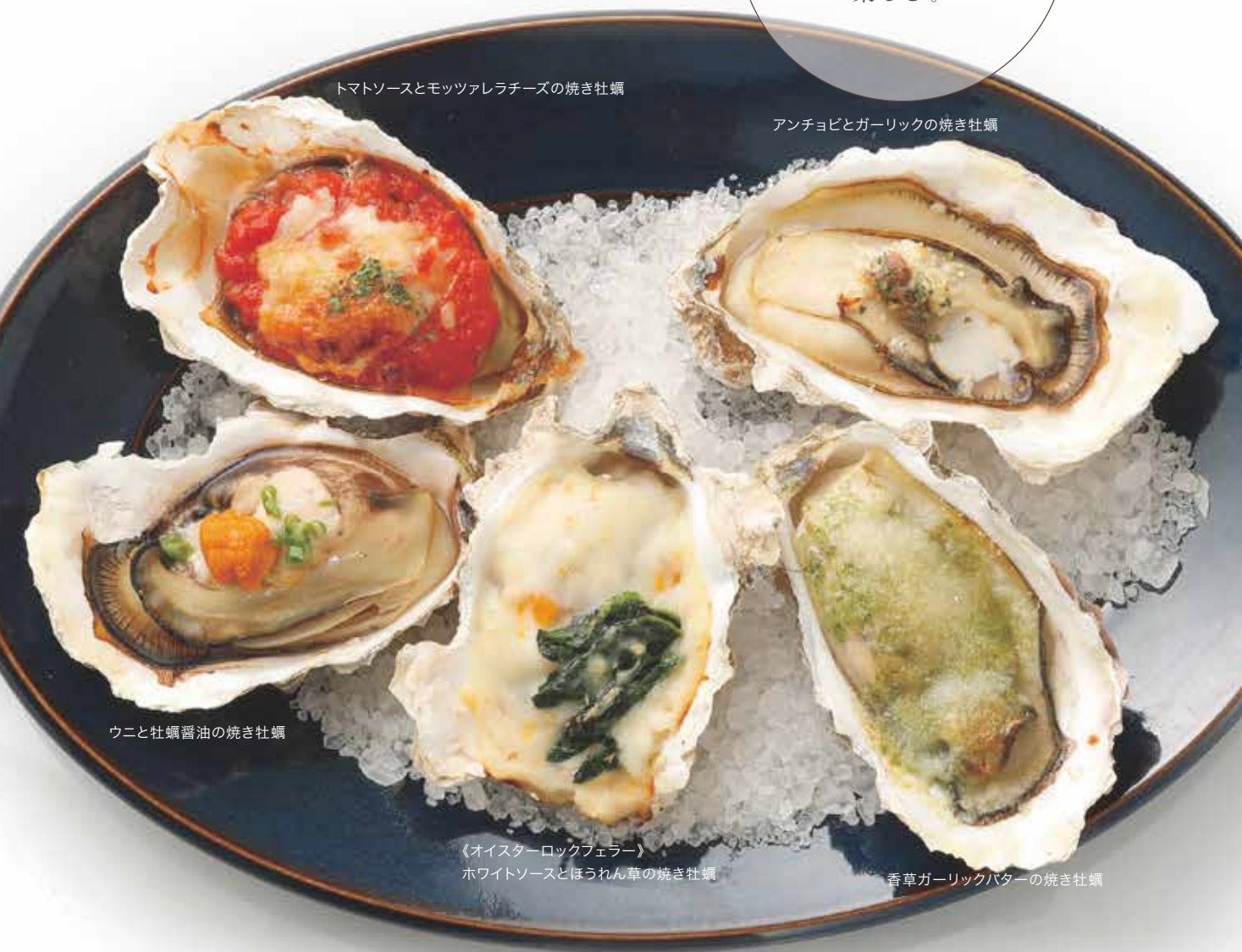
トマトソースとモッツアレラチーズの焼き牡蠣