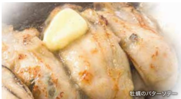
牡蠣のバターソテー