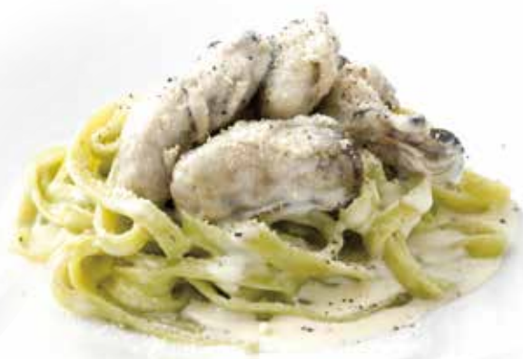
Oyster Cream Spinach Tagliatelle